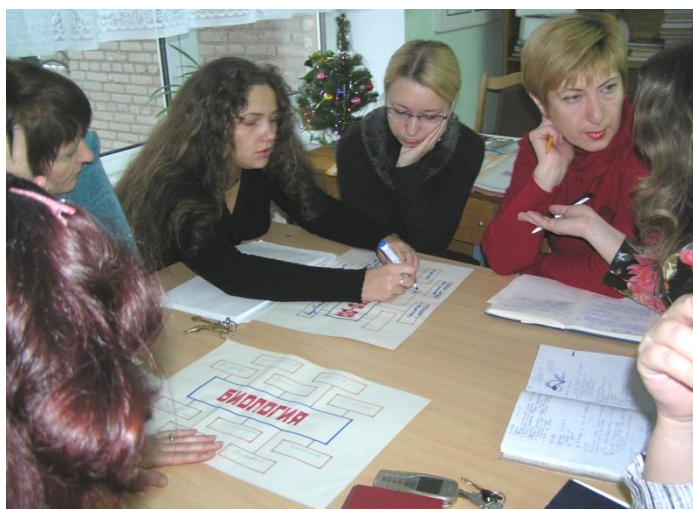
Творческая лаборатория педагогов лицея